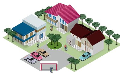
●コミュニティーガス団地のお客様